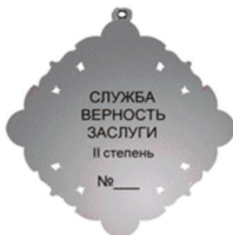
оборотная сторона знака «За заслуги перед Московской областью» II степени