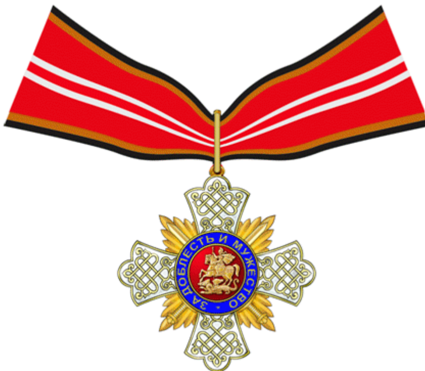
знак «За доблесть и мужество» с двумя перекрещенными мечами остриями вверх на ленте