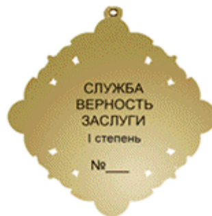
оборотная сторона знака «За заслуги перед Московской областью» I степени