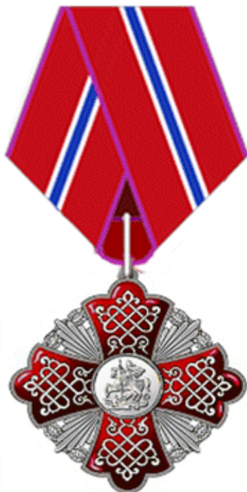
знак «За заслуги перед Московской областью» III степени на ленте