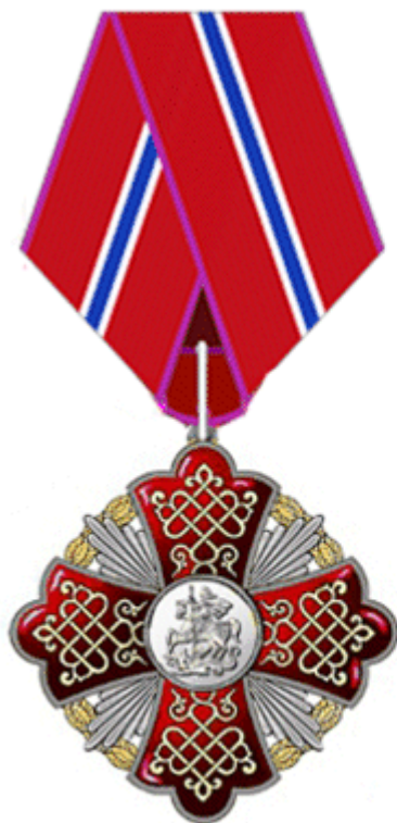
знак «За заслуги перед Московской областью» II степени на ленте