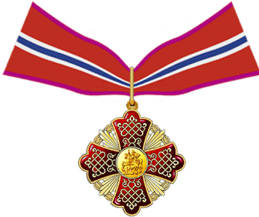
знак «За заслуги перед Московской областью» I степени на ленте