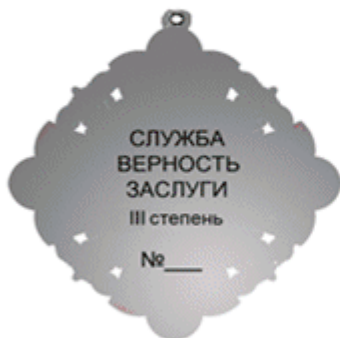
оборотная сторона знака «За заслуги перед Московской областью» III степени