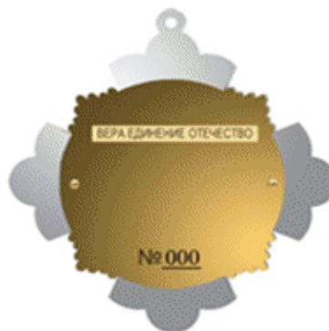
оборотная сторона знака Преподобного Сергия Радонежского

Приложение 3 к Закону Московской области "О внесении изменений в Закон Московской области "О наградах Московской области"