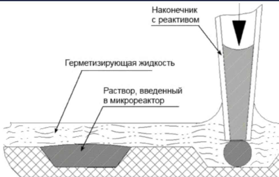
Рис.1. Введение реакционной смеси в микрореакторы.